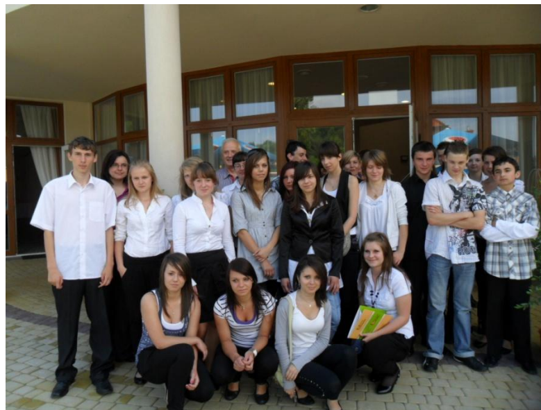
Powitanie i wspólne pamiątkowe zdjęcie wraz z właścicielem

W hotelu zgodnie z tradycją polskiej gościnności powitani zostaliśmy przez właściciela obiektu oraz panią menager i pracowników obiektu.